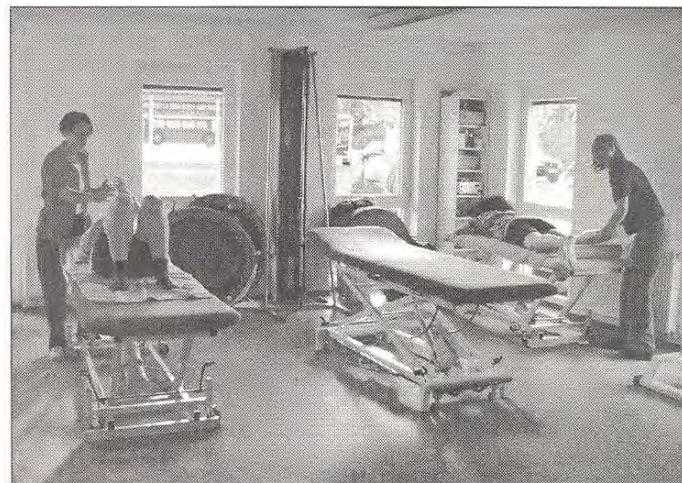
Die Behandlung in den KG-Räumen findet in einem angenehmen Ambiente statt.

Der Neubau in Schlattwiesen 4 entstand in knapp neun Monaten. Die ImmoBau GmbH aus Sonnenbühl als Bauträger und Architekt André Furch aus Hechingen-Schlatt erstellten in enger Zusammenarbeit mit den Rehaktiv-Geschäftsführern einen Neubau, der perfekt auf die Bedürfnisse der Praxis und des Studios zugeschnitten ist. Helle Materialien, Details in der Farbgestaltung und großzügige Fenster verleihen den Räumen einen freundlichen und angenehmen Charakter. Auffallend ist der Lichthof mit einem großen Glasdach, der das Tageslicht in das Gebäude lenkt.